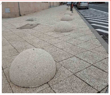
Бетонная полусфера (ограничитель парковки)